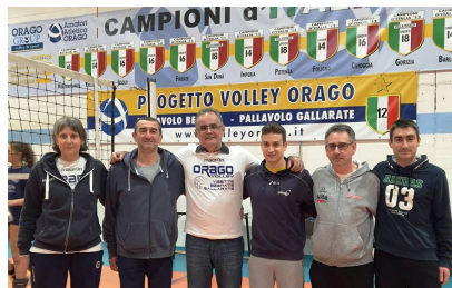
L'Italo-Brasiliano MARCO AURELIO MOTTA, uno dei più grandi allenatori al mondo, in visita ad Orago (al centro con parte dello Staff oraghese)

1° serie PO- promozione diretta in D dal 26 aprile al 15 maggio eventuale 2° serie Play-off dal 16 al 28 maggio