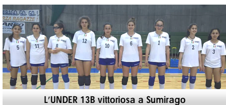
L'UNDER 13B vittoriosa a Sumirago

ritorno - venerdì 22 aprile ore 18,30 ORAGO/CASTIGLIONE - SUMIRAGO