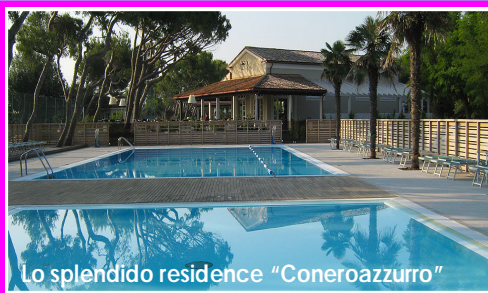
Lo splendido residence "Coneroazzurro"

ORAGO - CERMENATE NOVATE - perdente 1° gara NOVATE - vincente 1° gara